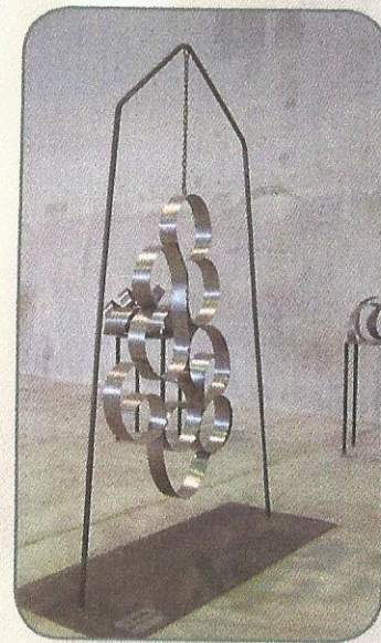
„Harmonie“ Marktplatz Nr. F